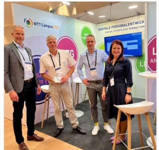
Netzwerken mit dem WTT CampusONE-Team

Neben der Keynote Speech zum Thema „Digitale Personalentwicklung in der Kommune – Schlüssel zur zukünftigen Gestaltung“ und der Dialogveranstaltung mit den Städten Chemnitz und Neuss, wo wir intensiv über die Erfahrungen der letzten